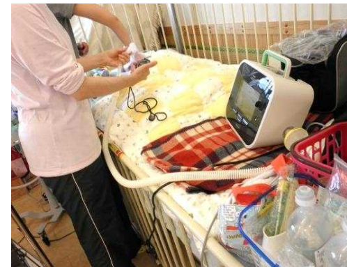
カフアシストによる排痰