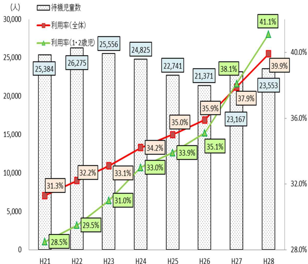
●待機児童数及び保育利用率の推移