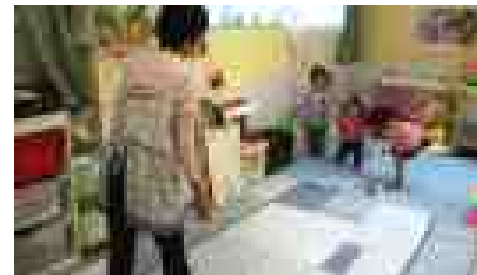
(託児サービスの様子)