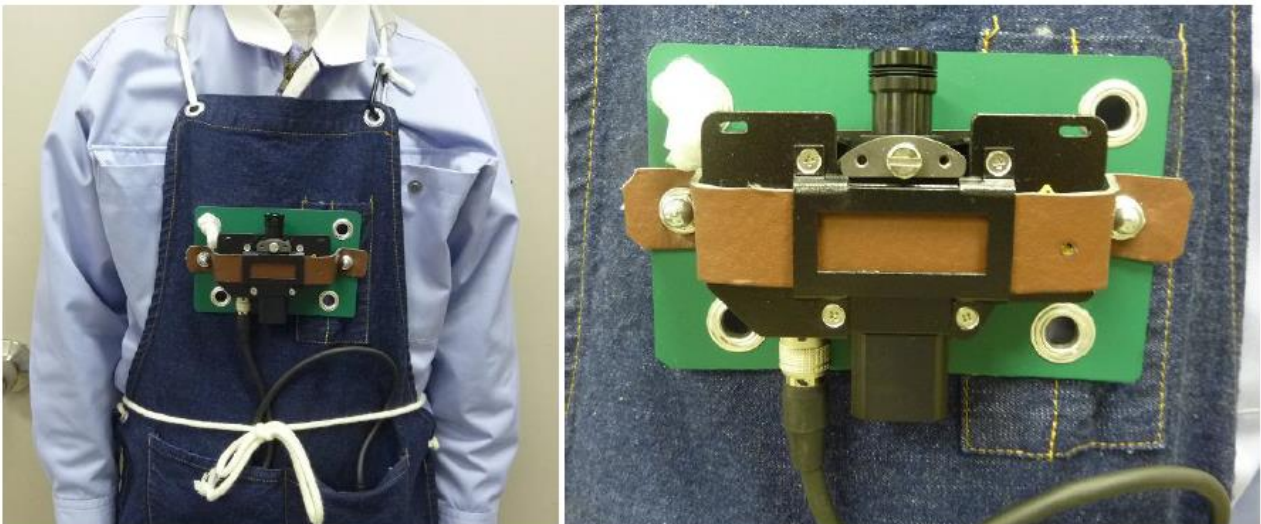
個人曝露測定用粉じん計 柴田科学 LD6N

現状では粉じん計の吸引ポンプの力が弱くサイクロンの装着は難しい。または別途吸引ポンプを準備して併行測定も同時に行う方法もある。