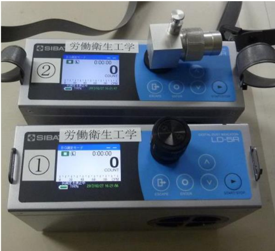
粉じん計 柴田科学 LD-5R PM2.5サイクロンの有(上)無(下)