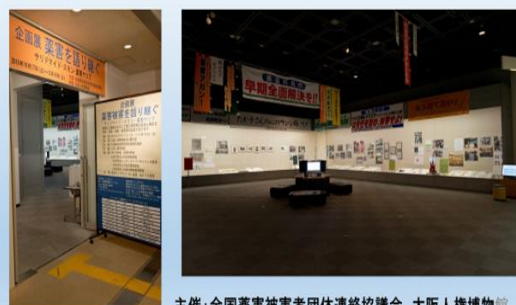
主催：全国薬害被害者団体連絡協議会、大阪人権博物館