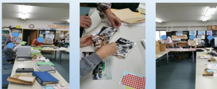
薬害スモン、ヤコブ関連資料整理の姿