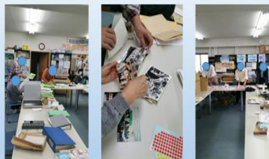
薬害スモン、ヤコブ関連資料整理の姿