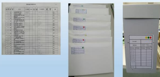
薬害スモン、ヤコブ、筋短縮症関連資料