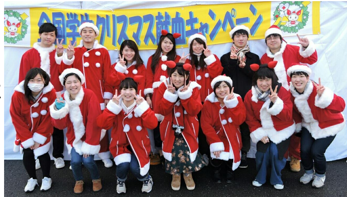
平成28年 山形北イオンでの様子

学生同士で検討を行い、記念品やそのデザインを決定し、各都道府県で実施するキャンペーンの記念品として献血者へ進呈している。