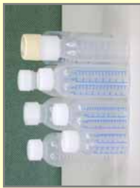
水薬容器的の例(医療用医薬品)

東京都は、子供のいる家庭の保護者に対し、子供の誤飲事故の危険性、医薬品等保管の重要性及びチャイルドレジスタントの考え方などについて普及啓発すること 国は、子供の誤飲事故情報の収集・提供等、誤飲防止対策に積極的に取り組むこと 薬剤師会は、医薬品の保管に対して、薬局窓口で消費者啓発を行うこと