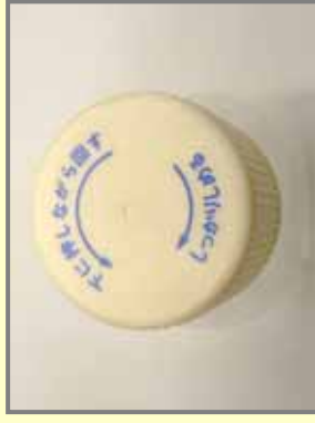
CR容器的(押しまわし式)のキャップ