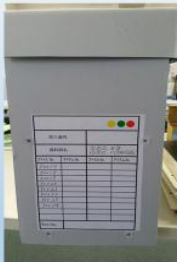
薬害スモン、ヤコブ、筋短縮症関連資料