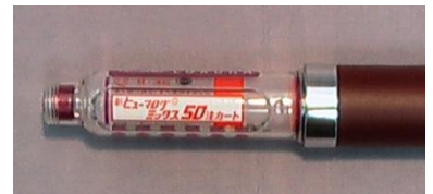
ヒューマログ ミックス50注 カート