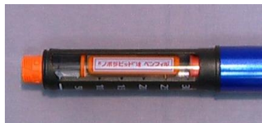
ノボラピッド注 ペンフィル