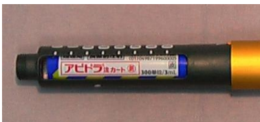
アピドラ注 カート