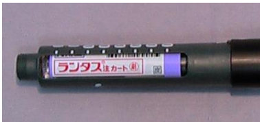
ランタス注 カート