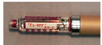
ヒューマログ注 カート