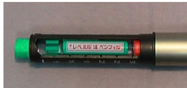
レベミル注 ペンフィル