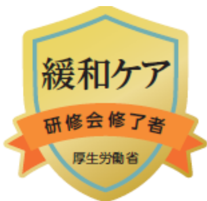
研修会修了者バッジ