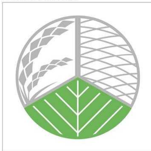
料理IIIの料理に表示する場合