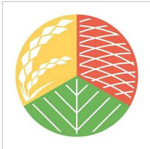
〈基本形〉 3つの料理の組合せの場合