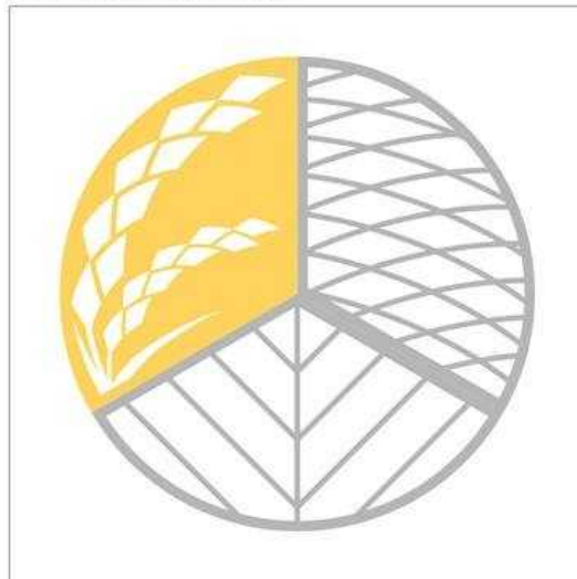
料理Iの料理に表示する場合