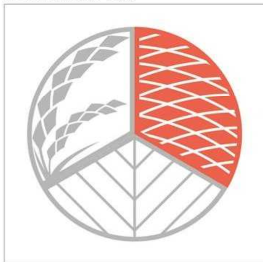
料理IIの料理に表示する場合