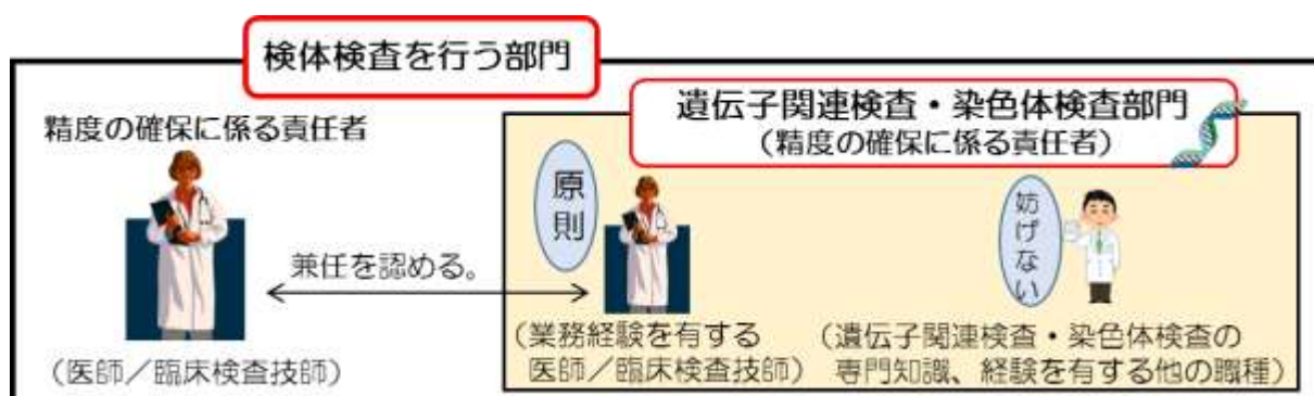
(図5-1) 検査全般の精度の確保に係る責任者と遺伝子関連検査・染色体検査の精度の確保に係る責任者の関係について