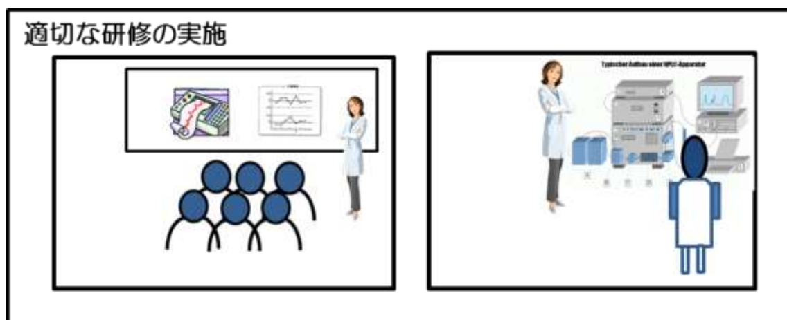
(図5-3) 適切な研修の実施について

※研修の実施方法は、集団で行う場合（外部の研修への参加を含む）、職員に対して個別に行う場合など、様々な方法が考えられる。