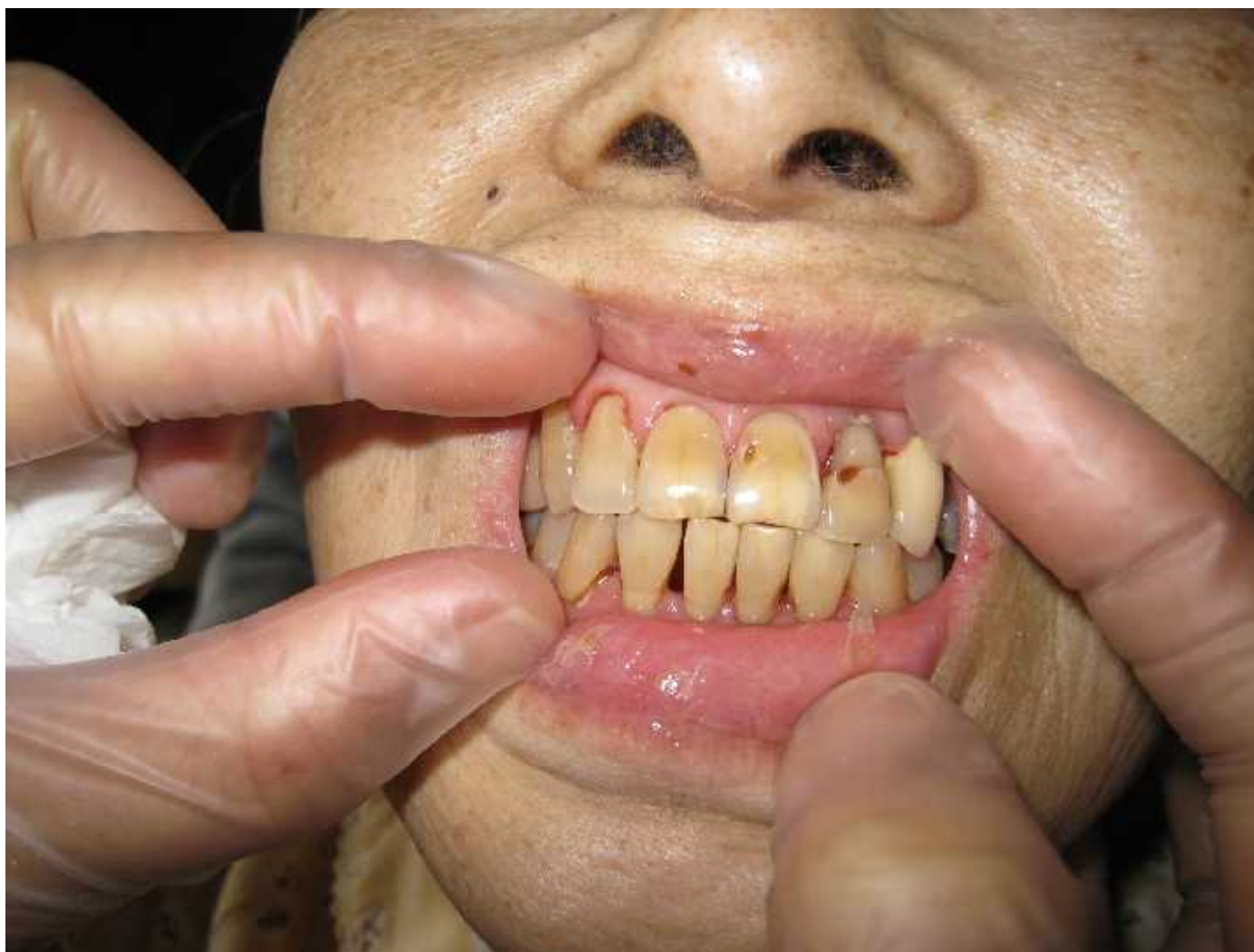
歯科衛生士による口腔ケア後の状態(所要時間数分間)