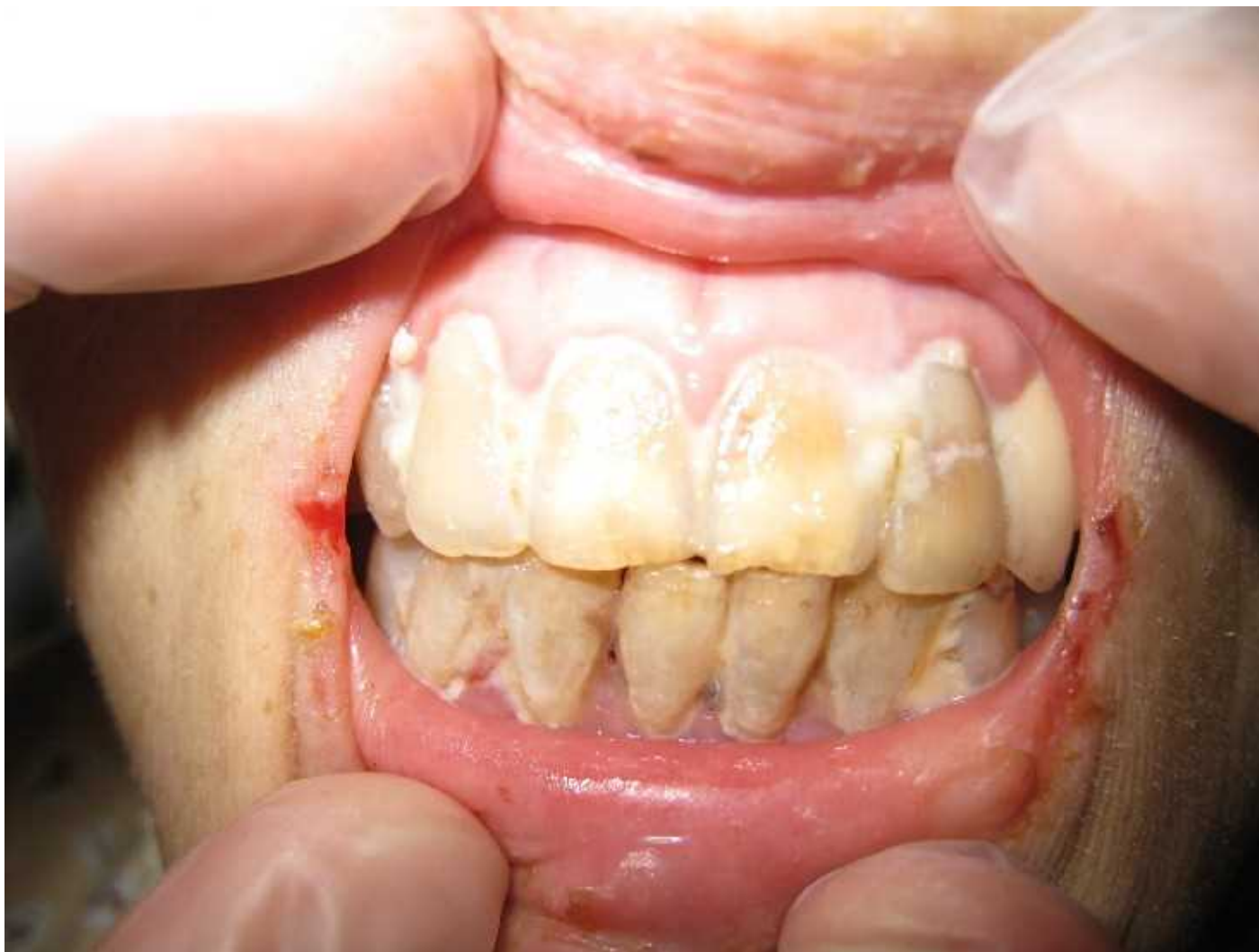
がん終末期患者の口腔内の状態例(死亡前1か月)