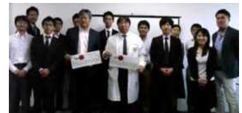
集中研修(平成27年10月)