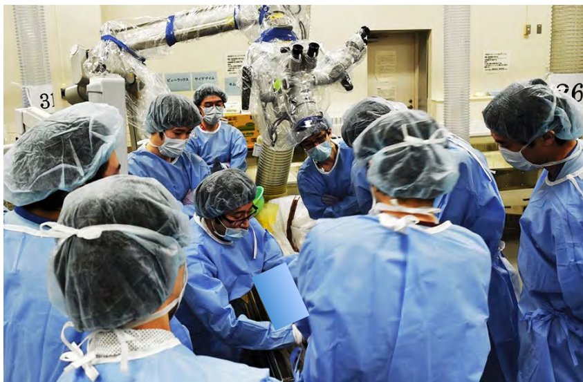
経蝶形骨洞法の研修(神経外科)