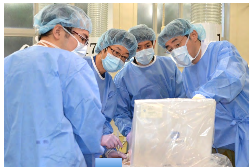
神経ブロックの研修(麻酔科)