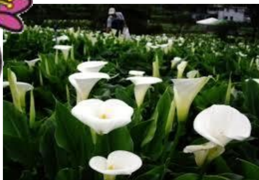
恋人(小糸)の「カラー」