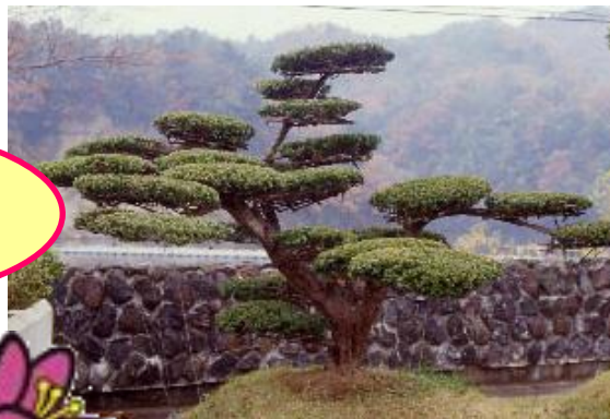
君津市の木「キャラ」