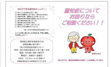
2 認知症初期集中支援チームの案内(砂川市)