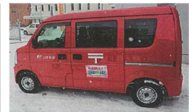
4 見守りステッカーを貼る事業者(岩手町)