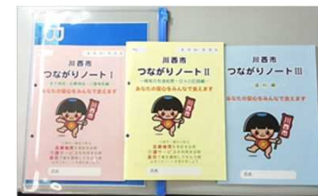
3 医療介護情報連携ツールの一例(川西市)