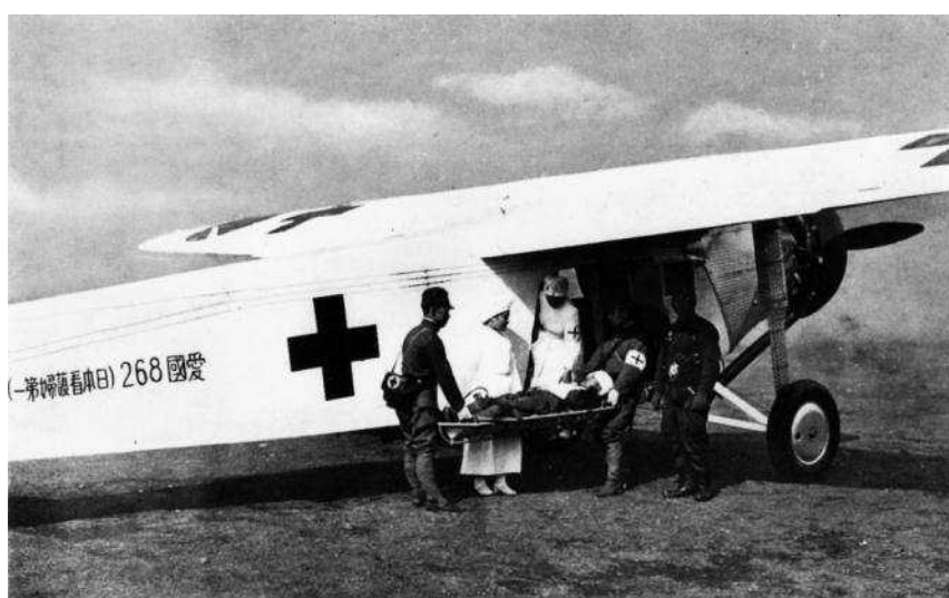
患者飛行機による戦傷病者の搬送