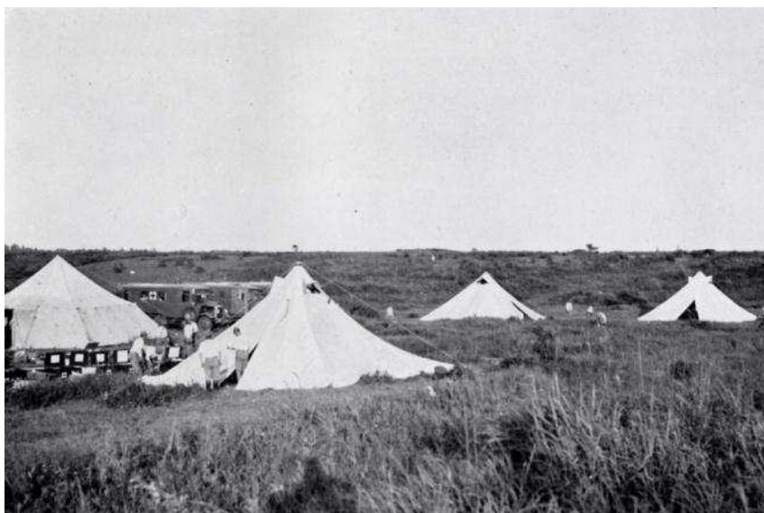
野戦病院（移動病院）の手術用天幕

野戦病院はテントを利用した移動病院で、軍医による本格的な手術、処置が行われます。