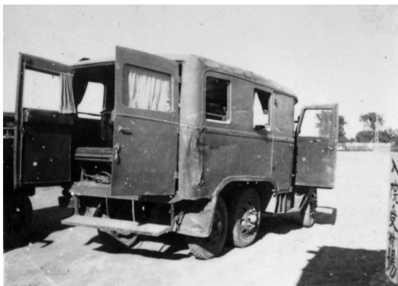
ようやく兵站病院にたどり着いた九四式患者自動車

今回の企画展では、戦地で運用された多様な患者搬送を、貴重な写真資料で紹介します。時間との闘いが戦傷病者のその後にどのような影響を与えたのか、その労苦を偲びます。