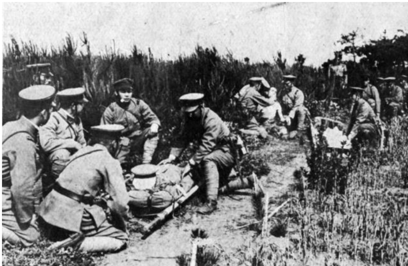
包帯所における第一線救護の訓練風景

包帯所では衛生兵による初期治療が施されます。重傷者は前線から野戦病院に後送されます。