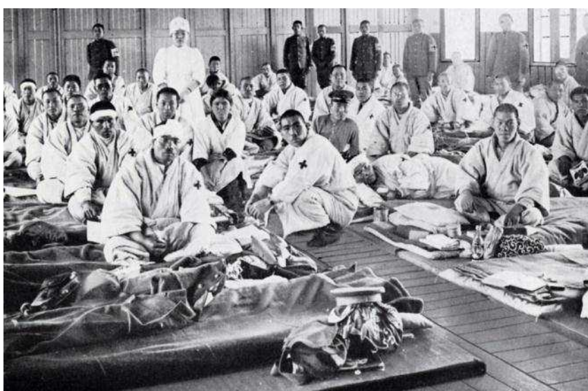
兵站病院に収容された戦傷病者たち

患者自動車や自動貨車（トラック）で、戦地を離れた兵站病院で体力の回復を図ります。