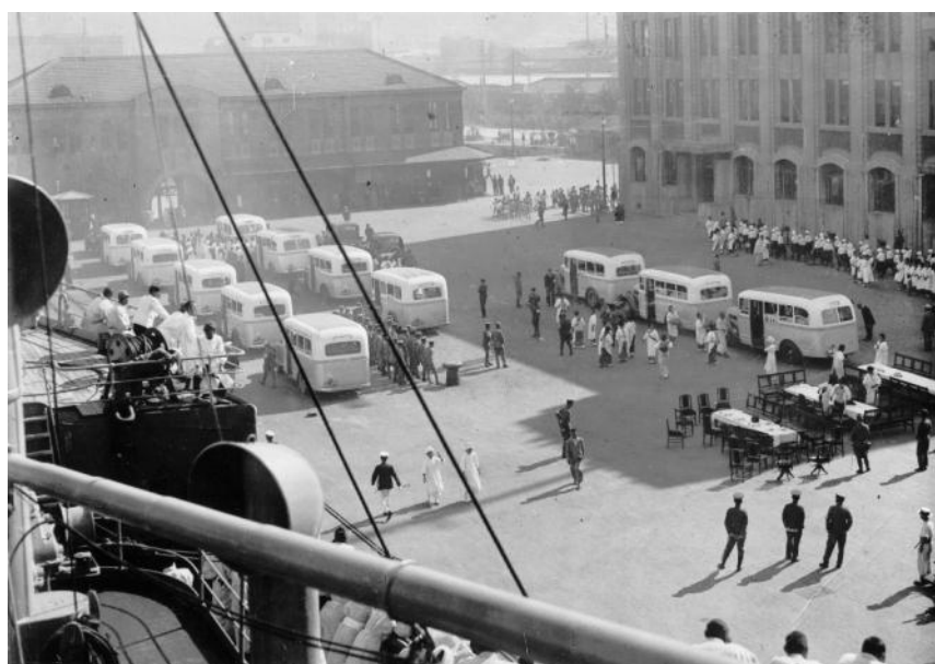
懐かしい故郷に、やっとたどり着きました