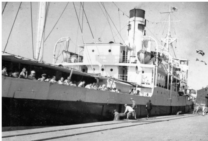
病院船による内地への帰還