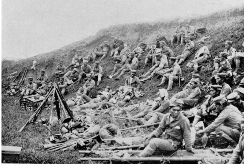
日露戦争時の満洲における臨時包帯所の情景