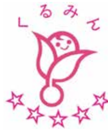
次世代認定マーク 「くるみん」

次世代育成支援対策推進法に基づき、一般事業主行動計画の策定・届出を行った企業のうち、計画に定めた目標を達成し、一定の基準を満たした企業は、申請を行うことにより、「子育てサポート企業」として、厚生労働大臣の認定(くるみん認定)を受けることができます。