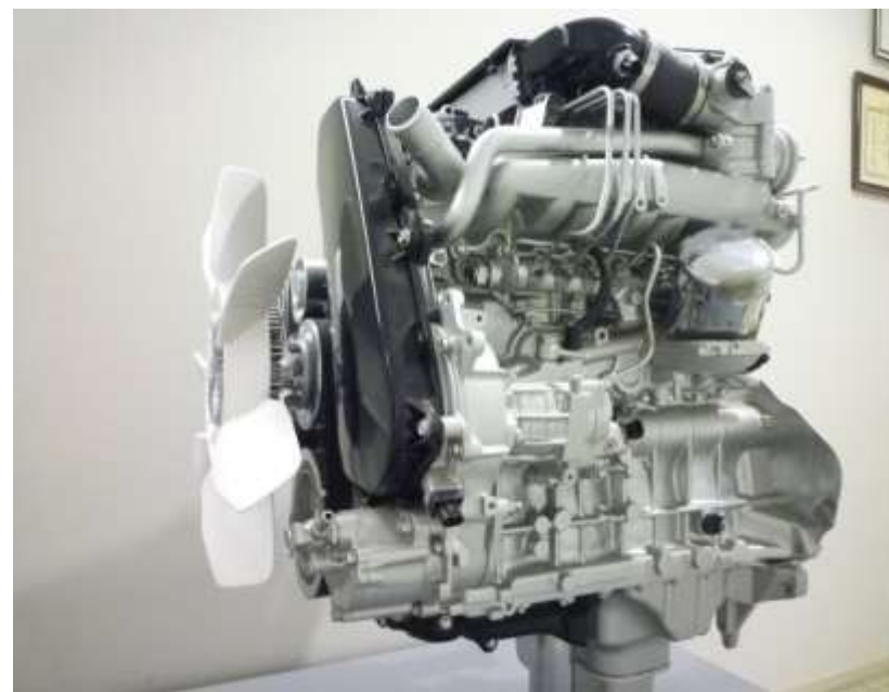
直列4気筒 3000CC 高効率型ディーゼルエンジン