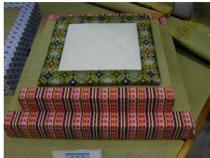
しとね 御神座（上段はお 茵、中段が八重畳、下段は厚畳）