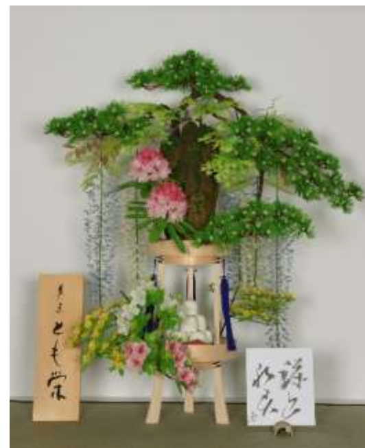
みやまにぎはる 作品名：深山和春（第 25 回全国菓子大博覧会／工芸菓子名誉総裁賞）