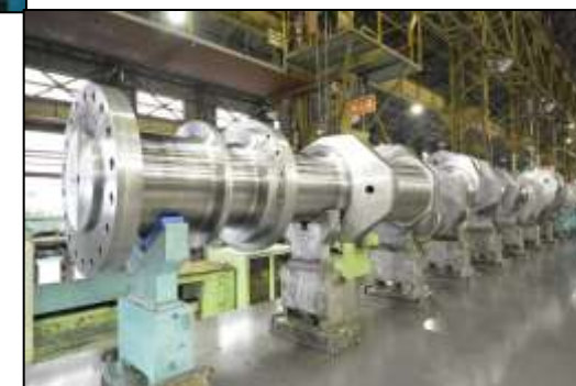
写真右 一体型クランク軸（完成品）