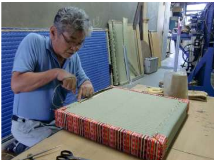
かまちぬ 八重畳製作風景（框縫い）