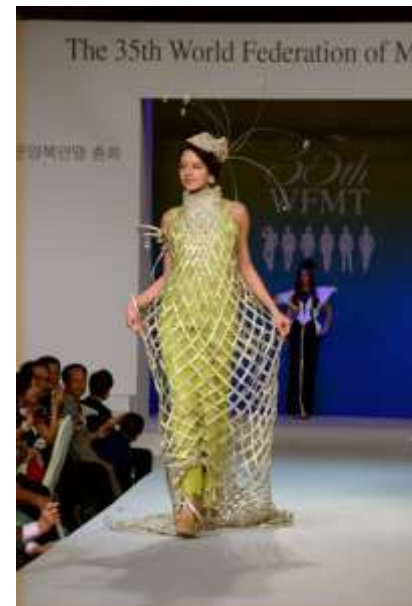
2013年韓国ソウル世界大会出品作品