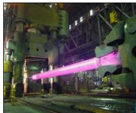
写真左 4000 トンプレスにて鍛造作業を完了した長尺軸材