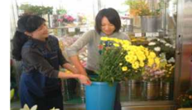
【左:企業説明会】【中:キャリア探索プログラム】【右:高校生の職場体験】