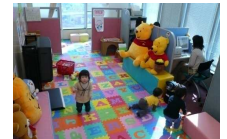
全オフィスに保育士を常駐安心してお仕事探しに専念