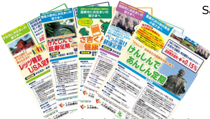
Sample product flyer

National health insurance society, etc.: 6 products