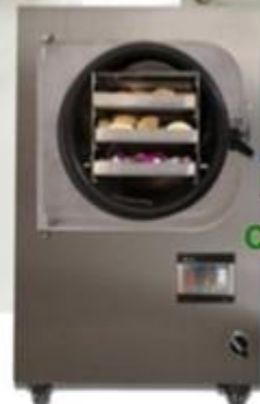
CDSH 100 (SUS304)