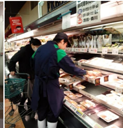
ゆるやかな就労体験