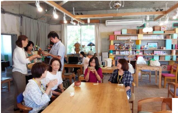
当事者の参加の場