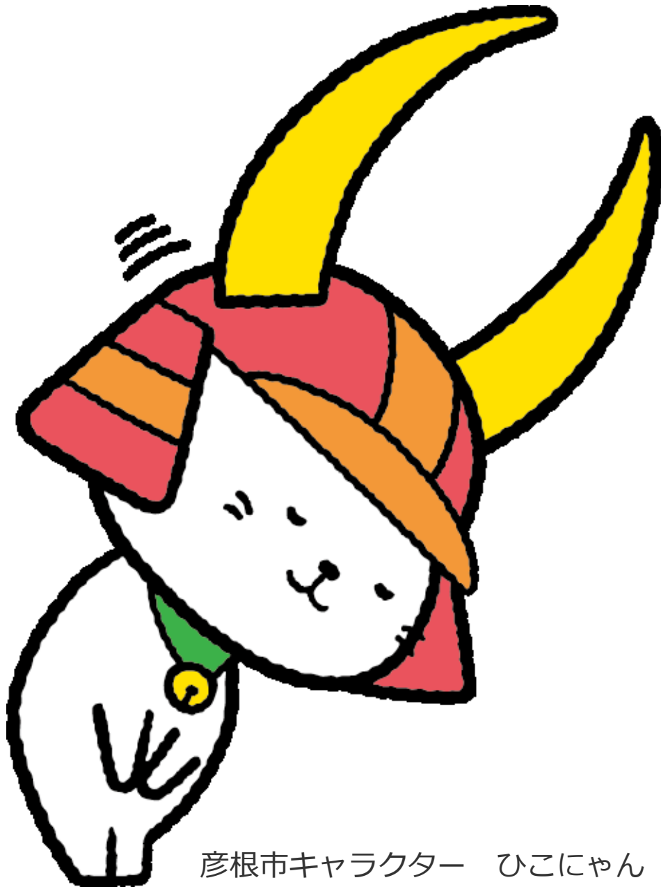
彦根市キャラクター ひこにゃん

びわ湖と鈴鹿山系に囲まれた豊かな自然に恵まれた本市は、江戸時代に彦根藩35万石の城下町として本格的な歩みを始め、現在に至るまで歴史的、文化的な風情を色濃くとどめるとともに、中世から近世にかけての貴重な歴史遺産が今なお、数多く存在しています。