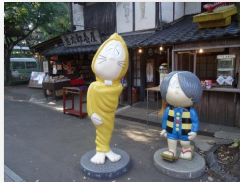
（深大寺門前にある鬼太郎茶屋）