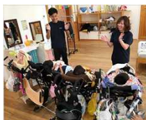
【児童発達支援、放課後等デイサービスの活動】