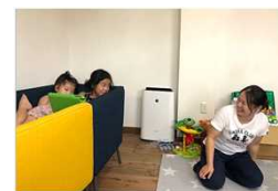
【2階ではきょうだい児が遊ぶ】