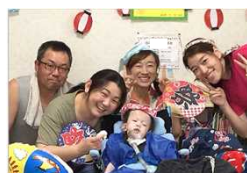
【訪問支援のケア、活動の様子】