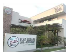
【重症心身障害者(18歳以上)の事例を紹介】