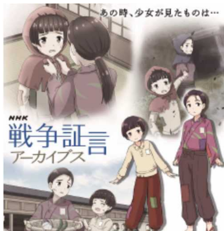
同漫画家の作品例

複数の漫画家候補の中から、子どもが親しみやすく読みやすい漫画タッチという視点から、現役の小学校教員の意見をもとに決定。