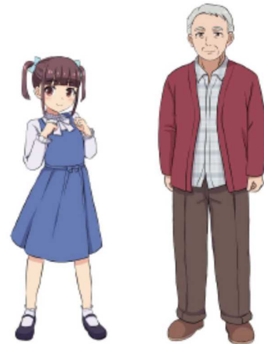
登場人物サンプル (小学5年生と町内会のメンバー)