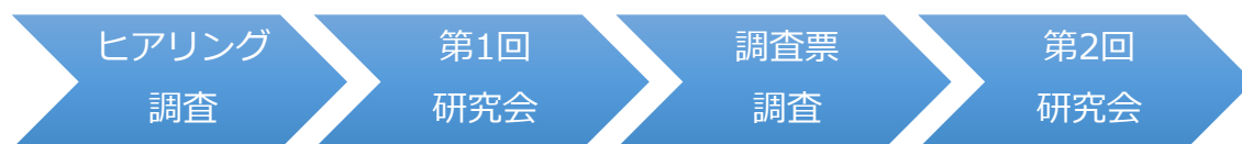
図表1 事業全体の構成

また、それぞれの調査で把握すべき項目の選定や、調査結果を踏まえた課題の整理に当たって指導・助言を得るため、7名の有識者からなる「研究会」を2度開催した。第1回研究会においては、ヒアリング調査の結果を踏まえ、調査票調査で把握すべき課題・項目の検討を行い、第2回研究会においては、調査票調査の結果を踏まえて、今後優先して検討すべき課題の整理を行った。