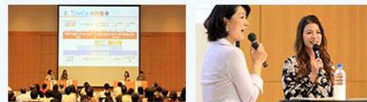
福岡会場 左:シンポジウムの様子 右:トークショー