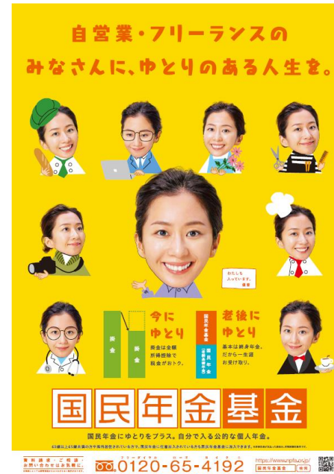
国民年金基金ポスター