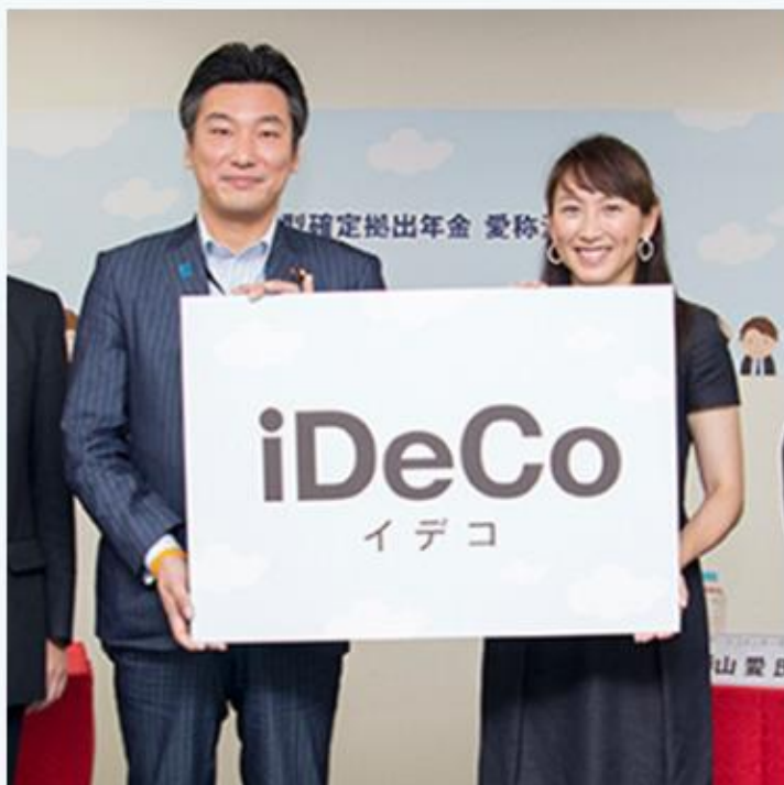
左：橋本 岳 厚生労働副大臣(当時) 右：杉山 愛さん

本協議会では、個人型確定拠出年金の愛称について、2016年8月1日から8月21日まで、インターネットで公募を行いました。応募総数4,351件の中から、愛称選定委員会により「iDeCo(イデコ)」が選定され、9月16日に決定しました。