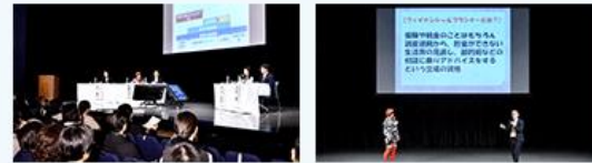
大阪会場 左:シンポジウムの様子 右:トークショー