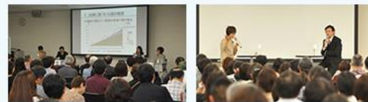
札幌会場 左:シンポジウムの様子 右:トークショー