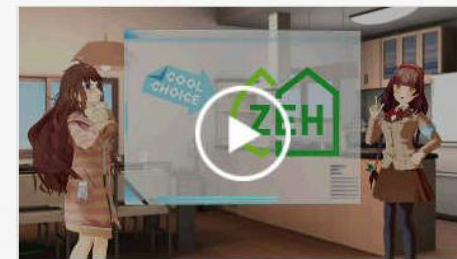
省エネ住宅・家電編：COOL CHOI CE イメージキャラクター3DCG動 画

#アニメ #君野イマ・君野ミライ #普及啓発 #地球温暖化対策 #省エネ住宅 #木材・間伐材