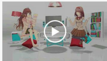
COOL CHOICEコンセプトムービー