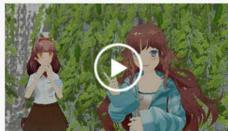
クールビズ×クールシェア×省エネ 家電編：COOL CHOICE イメージ キャラクター3DCG動画

#アニメ #君野イマ・君野ミライ #普及啓発 #地球温暖化対策 #省エネ家電 #クールビズ #空調 #省エネ #節電