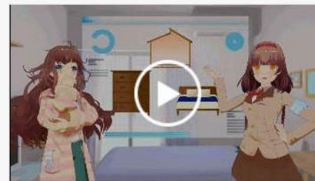
木材利用×省エネ住宅編：COOL C HOICE イメージキャラクター3DC G動画

#アニメ #君野イマ・君野ミライ #普及啓発 #地球温暖化対策 #省エネ家電 #クールビズ #空調 #省エネ #節電