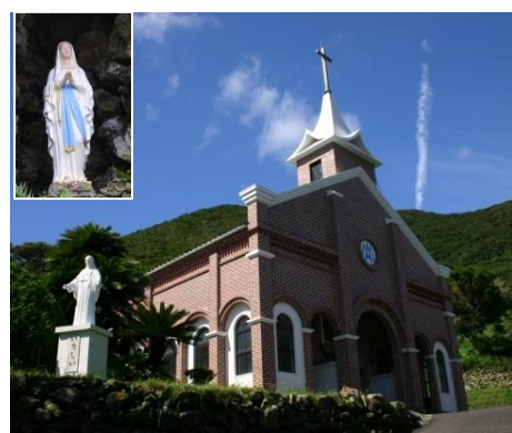
井持浦教会(ルルド) 日本最初の霊泉地