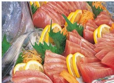
五島産養殖まぐろ