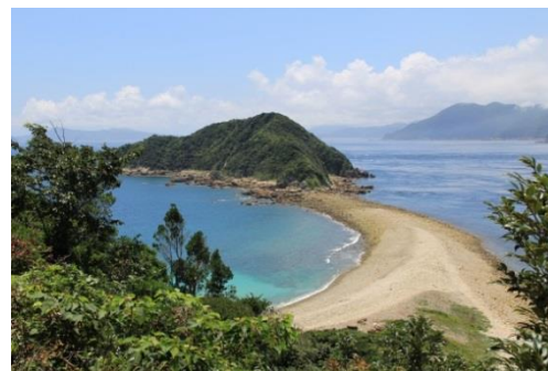
前島のトンボロ (奈留)