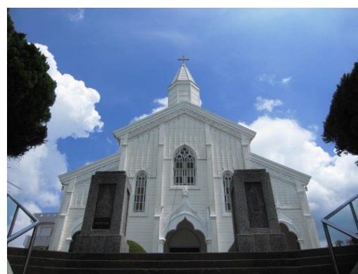
水ノ浦教会 白亜の木造教会