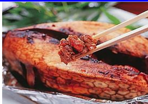
はこぶぐの味噌焼き