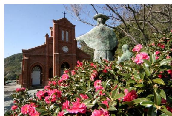
堂崎教会 禁教令解除後の五島最初の教会