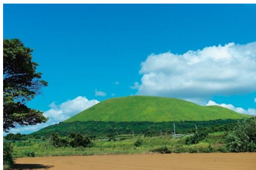
鬼岳 (福江島のシンボル)