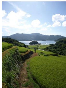
久賀島の棚田 (重要文化的景観)