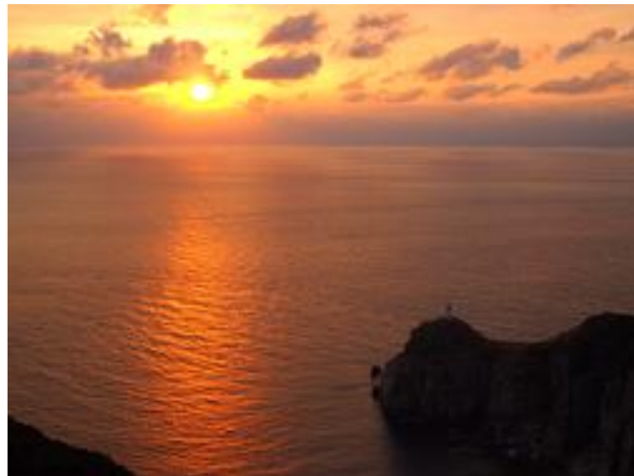
大瀬崎灯台 (日本の灯台50選/日本の夕陽百選)