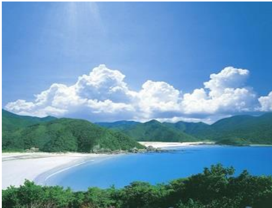
高浜ビーチ (日本の渚100選/快水浴場百選)