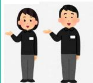
アウトリーチ支援員