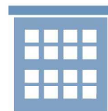
年金事務所・ 市区町村の年金窓口