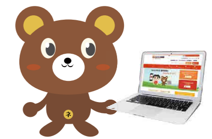
ねんきんクマ 「ねんきんネット」マスコット