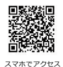
スマホでアクセス

ねんきんネット 検索 https://www.nenkin.go.jp/n_net/