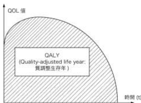
図 QALY の概念図

質調整生存年(QALY)は、生存年にQOL値を乗じることにより得られる。QOL値が1は完全な健康を、0は死亡を表す。QOL値0.6の健康状態で2年間生存した場合、生存年は2年だが、 0.6 \times 2 = 1.2 QALY(完全に健康な状態で1.2年生存したのと同じ価値)と計算される。時間とともにQOL値が変化する場合、図のようにQOL値の経時変化をあらわす曲線下面積が獲得できるQALYとなる。