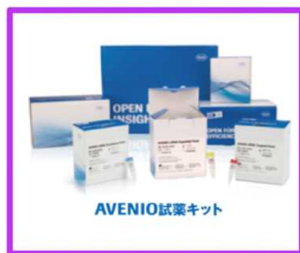
前処理試薬「AVENIO ctDNA Expanded Kit」

がん患者の血漿検体から抽出したctDNAにおけるパネル遺伝子の変異情報を包括的ゲノムプロファイリングとして同定することができる。