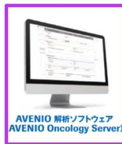
解析システム「アベニオ Oncology Assay 解析システム(仮称)」