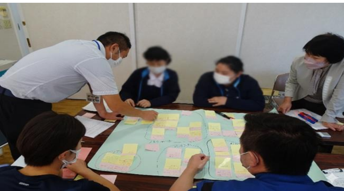
▼事業所を訪問して