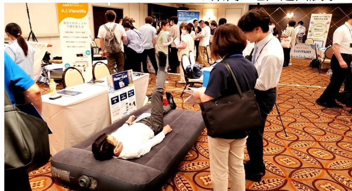
▼県内5地区巡回展示