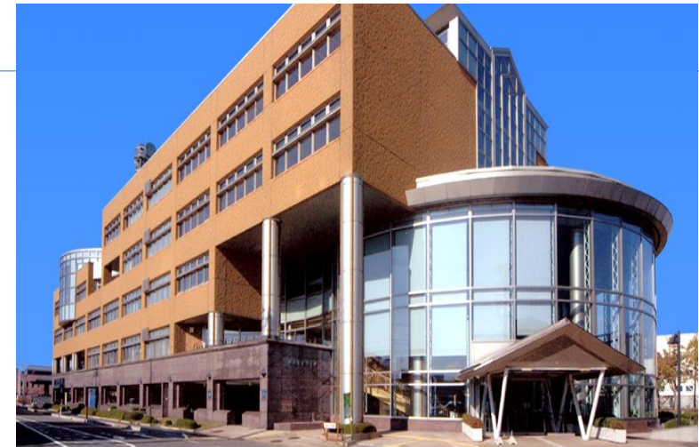
県民福祉プラザ(青森県青森市)