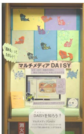
利用支援コーナーの展示