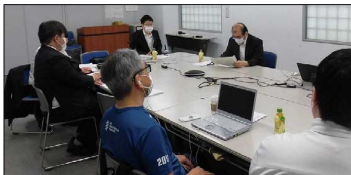
【写真：研修会の様子】