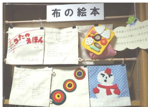
布の絵本展示の様子