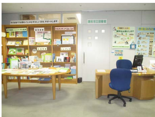
利用支援コーナー

具体的には、音訳サービス、点訳サービス、大活字本の提供、宅配サービス、子どもたちへの布の絵本・布の遊具の提供、ウェブサイトなどを音声で読み上げさせるためのパソコンや拡大読書器の設置などがあります。