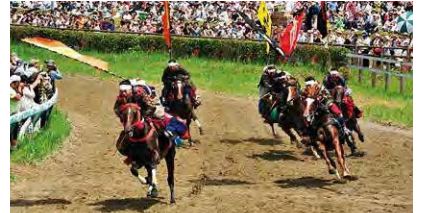
相馬野馬追(南相馬市)

相双地域は太平洋と阿武隈高原に囲まれた南北に長い地域です。気候は温暖で降雪も少なく、快適な居住環境があります。国指定重要無形民俗文化財の「相馬野馬追」が全国的に有名です。