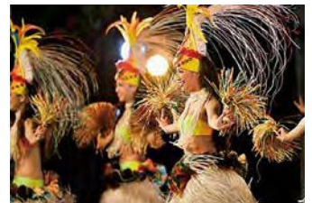
スバリゾートハワイアンズ

東は太平洋に面しているため、寒暖の差が小さく、温暖な気候に恵まれています。首都圏から最も近い炭鉱として栄えた歴史があり、映画「フラガール」の地としても知られています。