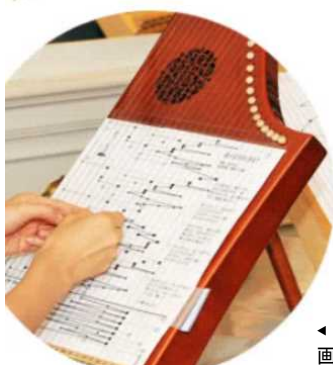
◀ ヘルマンハーブ

多様な主体で構成するコンソーシアムにおける学習支援のあり方の検討を踏まえて、実施されるプログラムのうち、県生涯学習センターにおける取組では、音楽の学習プログラムを開発する。障害者でも演奏しやすいヘルマンハーブを活用したワークショップを実施。