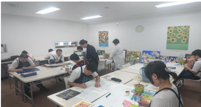
アーティスト社員の創作活動の様子