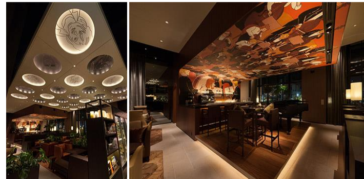
障害者アーティストの絵画作品を用いたインテリアデザイン