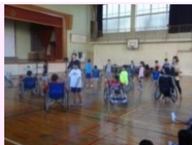
車いすダンスに挑戦する子供たち