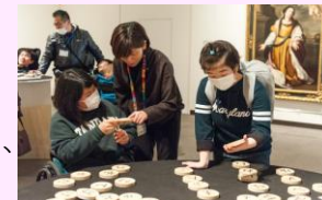
プロトタイプ体験の様子

三重県立美術館を中核に、連携校である特別支援学校とともに、デザイナーと協働したコレクション鑑賞のためのツールを開発。調査・検討段階から特別支援学校の生徒とともに開発に携わり、プロトタイプの展示や生徒によるプロトタイプの体験を実施。