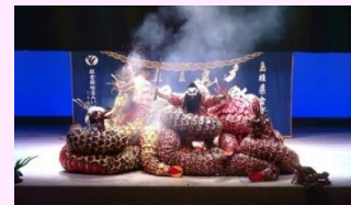
石見神楽「大蛇」(いわみ福祉社会芸術クラブ)

美術、和太鼓、神楽等の日本の障害者の優れた文化芸術活動の成果を、近年、文化芸術都市として注目を集めるフランス・ナント市から世界に発信。