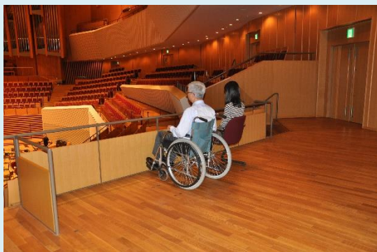
車いす用の広い鑑賞スペース・通路