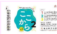
ここから展2 チラシ

国立新美術館において、障害の有無にかかわらず、身体や感覚、感性を揺さぶられ、ともに楽しむ展覧会を新たな意識、新たな「生き方の創造」につながることを期待して開催。