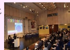
アール・ブリュット振興事業

「障害者等の文化芸術の魅力発信」「障害者等の文化芸術を推進する人材育成」「障害者等の文化芸術を支えるネットワーク構築」を柱とし、アール・ブリュット作品の展示や障害がある方を対象とした公募展、障害者の表現活動ワークショップ、アール・ブリュットに関心がある人・団体が構成する全国ネットワークの運営やシンポジウム、交流会等を開催。