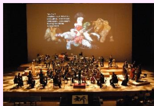
藝大アーツ・スペシャル2016 障がいとアーツ