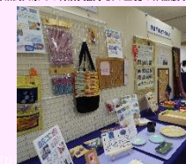
宮城高文祭での特別支援学校の生徒の作品展示

文芸、美術、音楽、演劇、伝統芸能、舞踊、演芸、障害者福祉に関するシンポジウム等を国民文化祭と同一県で開催。全国的な交流を通じ障害のある方の社会参加と障害のある方への理解促進に寄与。