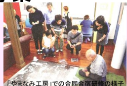
「やまなみ工房」での合同合宿研修の様子

藝大生と福祉施設の利用者の共同の創作活動を通じて、支援する、支援されるという関係ではなく、作家同士、人間同士の関係を構築。