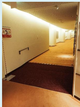
段差のない広い廊下