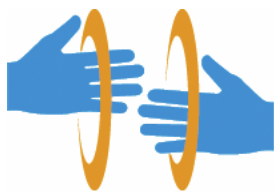
【手話マーク】 所管：一般財団法人全日本ろうあ連盟