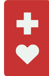
【ヘルプマーク】 所管：東京都