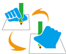
【筆談マーク】 所管：一般財団法人全日本ろうあ連盟