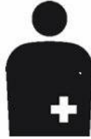
【オストメイト用設備/オストメイト】 所管：公益社団法人交通エコロジー・モビリティ財団