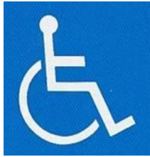
【障害者のための国際シンボルマーク】 所管：公益財団法人日本障害者リハビリテーション協会