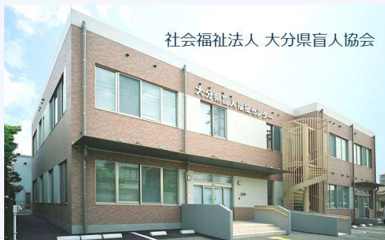
社会福祉法人 大分県盲人協会