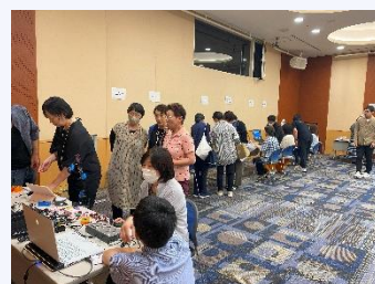
機器体験・相談会