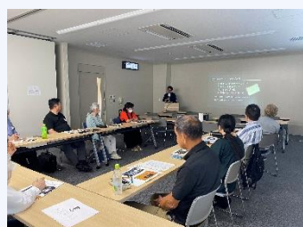
サポーター講習会