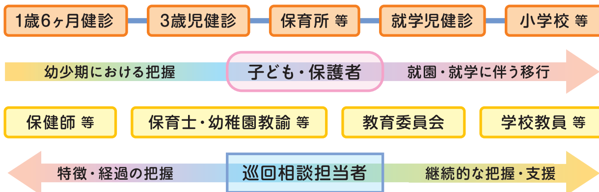
図 地域における子ども・保護者への継続的な支援体制の例

巡回相談担当者は、地域内の施設を巡回し相談活動を行うことができます。保健・医療・福祉・教育の各施設がそれぞれの専門性をもって支援を行い、巡回相談担当者が各機関の専門性を尊重しつつ、子どもの特性や行動の理解、支援方法を、機関を越えて「橋渡し」することで、ライフステージを通した「切れ目のない支援」を実現することができます。