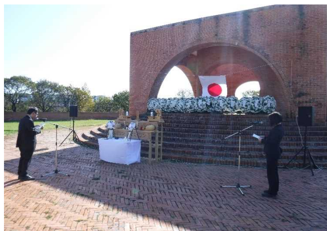
現地慰霊（ハバロフスク地方）