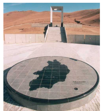
日本人死亡者慰霊碑（モンゴル）