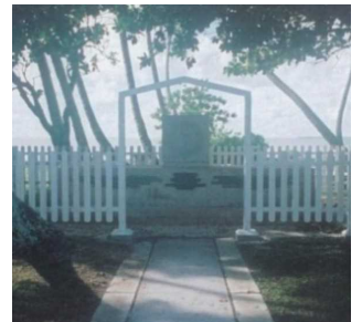
東太平洋戦没者の碑