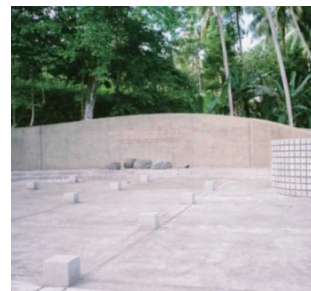
第二次世界大戦慰霊碑