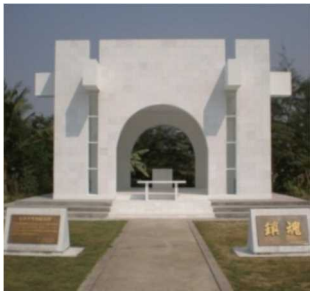
ビルマ平和記念碑