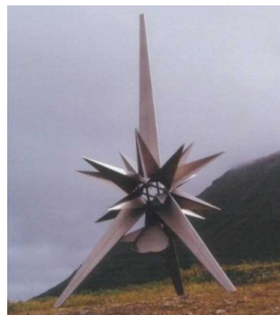
北太平洋戦没者の碑