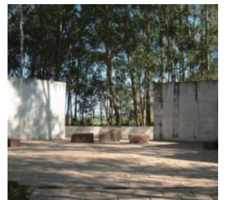
インド平和記念碑