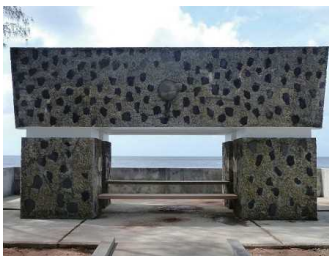
西太平洋戦没者の碑