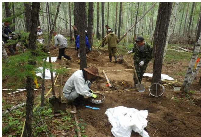
遺骨収容（ザバイカル地方）

こうした中、平成 28 年 3 月に「戦没者の遺骨収集の推進に関する法律」（平成 28 年法律第 12 号）が成立しました。戦没者の遺骨収集が国の責務と位置づけられたほか、令和 6 年度までの期間を遺骨収集施策の集中実施期間とすることや、関係行政機関と連携協力を図ることが規定され、同年 5 月には「戦没者の遺骨収集の推進に関する基本的な計画」が閣議決定されました。また、同年 8 月には、戦没者の遺骨に関する情報収集や遺骨収集を行う者として一般社団法人日本戦没者遺骨収集推進協会を指定し、同協会とともに遺骨収集を実施しています。