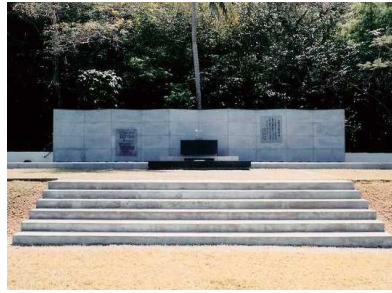
中部太平洋戦没者の碑