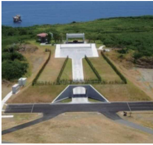
硫黄島戦没者の碑