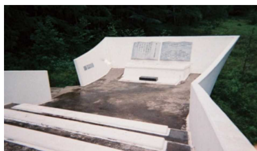
樺太・千島戦没者慰霊碑