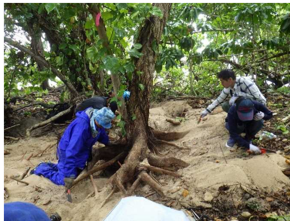
遺骨収容（マリアナ諸島）