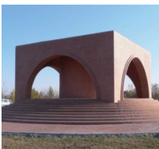
日本人死亡者慰霊碑（ロシア）