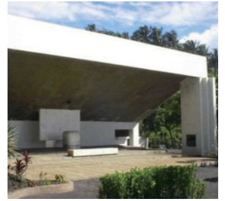
南太平洋戦没者の碑