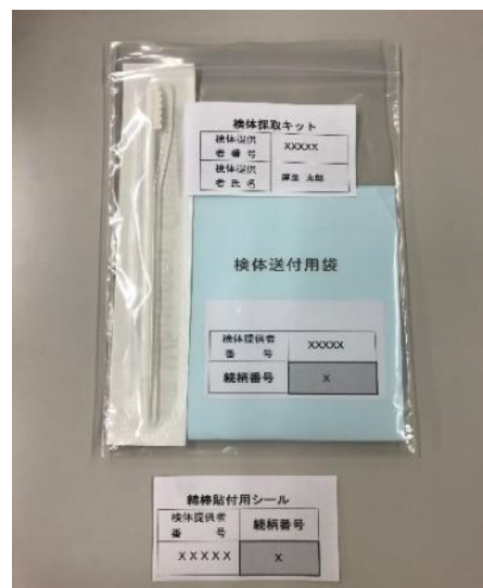
検体採取キット（御遺族用）

④ 「戦没者遺骨のDNA鑑定人会議」にて、DNA鑑定の結果について議論を行い、収集した御遺骨と御遺族の間に血縁関係があるかどうかを判定します。