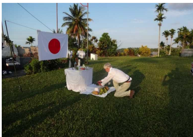
現地慰霊（東部ニューギニア）

厚生労働省では、戦没者への慰霊と平和への思いを込めて、昭和 45 年度以来、硫黄島と海外 14 か所に戦没者慰霊碑を建立しました。旧ソ連地域については、埋葬地のある地方毎に小規模な慰霊碑を順次建立しています。