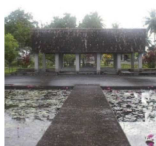
ニューギニア戦没者の碑