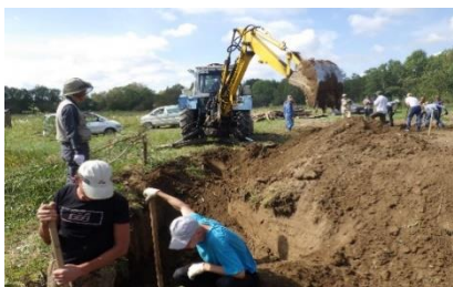
ロシア（ハバロフスク地方）