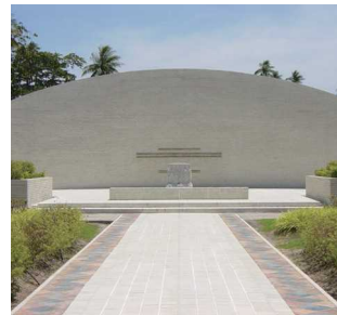
ボルネオ戦没者の碑